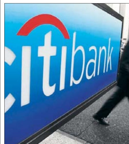
60 Prozent der kritisierten Kreditvergaben betrafen die Citibank.

sumer Bank besonders negativ aufgefallen. Die Verbraucherschützer bestätigen mit ihrer Dokumentation die jüngste Untersuchung der Stiftung Warentest zur Vergabe von Konsumentenkredit. Warentest hatte bei dem Gros von 13 untersuchten Banken und Sparkassen massive Mängel bei der Kreditberatung festgestellt und dabei ebenfalls die unzulässige und horrend teure Koppelung von Kon-